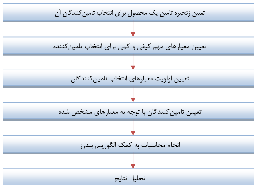
شکل ۱. چارچوب نظری و مراحل انجام تحقیق

در این تحقیق، به دنبال انتخاب تامین کنندگان برای برطرف کردن نیازهای یکی از کارخانه‌های بسته‌بندی و فرآوری انجیر در استان فارس هستیم. اصلی‌ترین ماده اولیه این کارخانه یعنی انجیر از بیرون از کارخانه از تامین کنندگان متعدد خریداری می‌گردد. هدف اصلی این تحقیق، پیدا کردن تامین کنندگان مناسبی می‌باشد که کالای نهایی درست در زمان لازم به دست مصرف کننده نهایی برسد. با مشخص شدن این موضوع مرحله اول از روش فوق محقق می‌گردد. در مرحله بعد باید معیارهای مهم کمی و کیفی در انتخاب تامین کننده مشخص گردد. با توجه به نظر متخصصان این رشته از ۲۳ معیاری که دیکسون در مقاله خود به آن اشاره کرده است، معیارهایی را که بیشترین تاثیر بر تامین کنندگان این کارخانه دارد را انتخاب کرده‌ایم. در مرحله بعد به کمک یکی از روش‌های اولویت‌بندی و رتبه‌بندی، اهمیت و اولویت شاخص‌های مذکور را تعیین می‌نماییم. این شاخص‌ها در نهایت در انتخاب تامین کنندگان نهایی مورد استفاده قرار می‌گیرند. اکنون با استفاده از معیارهای کیفی و کمی فوق و با استفاده از فرایند مدل‌سازی یک مساله برنامه‌ریزی ریاضی برای انتخاب تامین کننده مناسب طراحی می‌گردد. در مدل طراحی شده، تعداد محدودیت‌های مساله بسیار زیاد می‌باشد. مساله طراحی شده جزء مسایل NP-Hard می‌باشد. بنابراین جهت حل مدل انتخاب تامین کننده از الگوریتم بندرز اصلاح شده استفاده می‌شود که در ادامه به طور کامل توضیح داده خواهد شد. در نهایت با توجه به محاسبات انجام شده، تحلیل نتایج در خصوص انتخاب تامین کننده و پیکره‌بندی مجدد زنجیره تامین انجام می‌گردد.